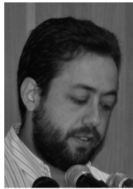
Του ΧΡΗΣΤΟΥ Κ. ΚΟΥΡΤΕΛΛΑΡΗ*

Είναι πραγματικά καταπληκτικό το θράσος κάποιων να προσπαθούν να κάνουν το άσπρο μαύρο και να προκαλούν κρίση, απλά και μόνο για να αποκομίσουν κομματικό και πολιτικό όφελος. Εισ βάρος όμως ποιών; Της μοιρασμένης μας Πατρίδας, των παθόντων, των προσφύγων, των εγκλωβισμένων που καρτερικά περιμένουν να ανατείλει ο ήλιος της ειρήνης και να ομιήσουν με τους δικούς τους ανθρώπους, χωρίς το τρομοκρατικό βλέμμα του κατοχικού στρατού.